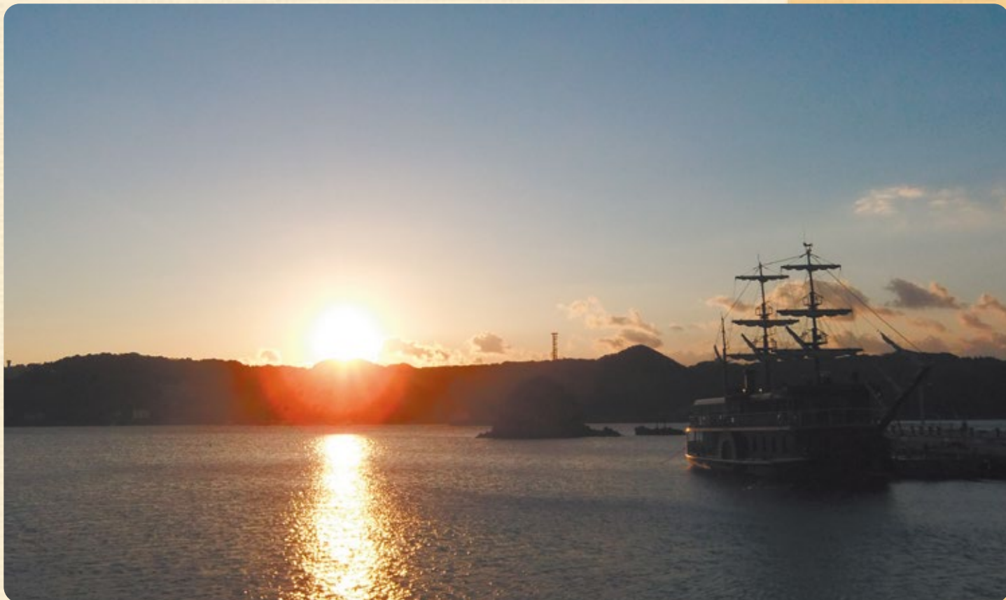
下田港からの朝日